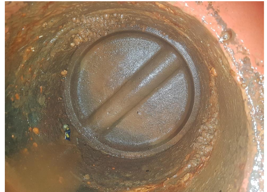
Wierpot september 2020